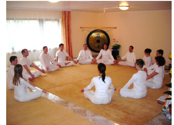
Energytraining Kyborg® Institut

In der Meditation auf die inneren Kräfte kann sich die Seele erholen, und wir erkennen schon bald, dass unser Leben einen höheren Sinn hat. Wir sehen unsere Aufgaben und Chancen in einem neuen Licht.