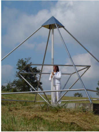
Meditation Pyramidenanlage Südfrankreich