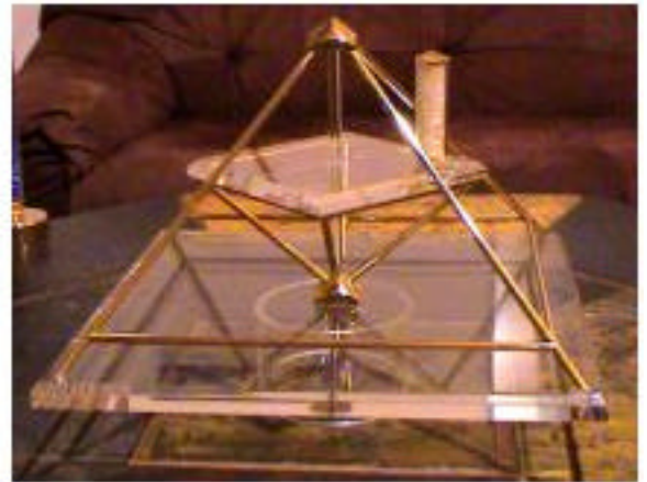
Bild rechts: seitliche Ansicht, der kleine Kristallstab steht in der Delle. Die Ritze zwischen den 2 halben Biokondensatorplatten sollte stets von NO nach SW verlaufen, dann fließt die Energie optimal. Die Delle sollte sich dann in der Position "Westen" befinden. Das ist die beste Stelle, um einen kleinen Kristallstab oder eine Kugel hinein zu legen. Wir arbeiten bei dieser Methode mit dem natürlichen Magnetfeld der Erde. Deshalb spielen diese Angaben eine Rolle!

Bild oben rechts: Modell A zum Größenvergleich mit Kristallstab von B und Taschenstab, steht in der Delle.